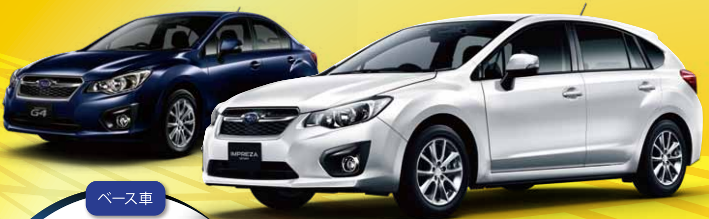
PHOTO: (左) G4 ディープシーブルーパール (右) SPORT サテンホワイトパール (31,500円高) ※実際のモデルとは一部仕様が異なります。