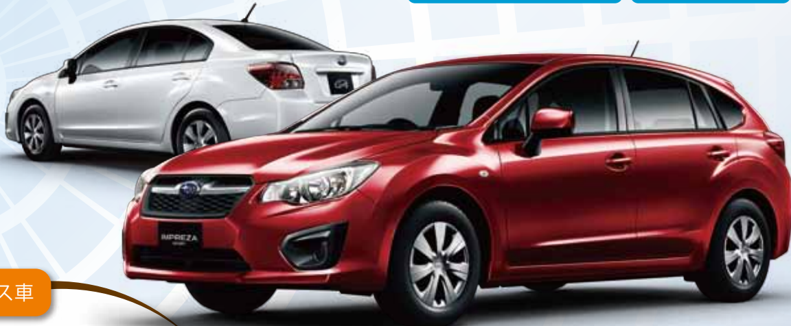
PHOTO: (左) G4 サテンホワイトパール(31,500円高) (右) SPORT ヴェネチアンレッドパール(31,500円高) ※実際のモデルとは一部仕様が異なります。